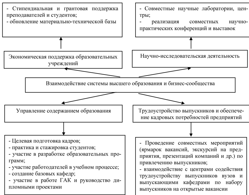
Рис. 1. Направления взаимодействия университета и бизнес-сообщества